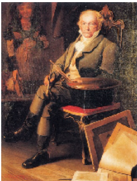
Marcelino de Unceta, Retrato de Francisco de Goya , c. 1868