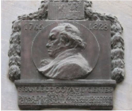
Mariano Benlliure, Goya de perfil con escudo de Zaragoza y Burdeos. Reproducción de la colocada en la casa de Goya en Burdeos. Regalo de Mariano Benlliure a la Academia, 1920

Real Academia de Bellas Artes de San Luis, Zaragoza